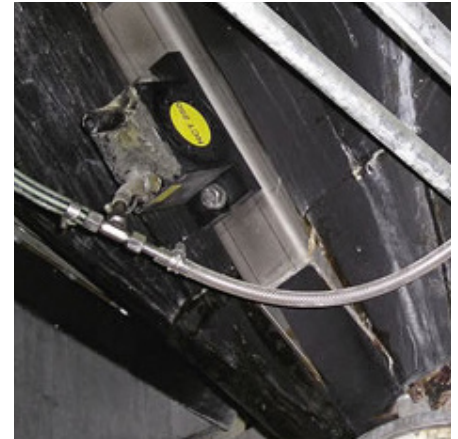
Dos vibradores de turbina NCT montados en una vasija larga.