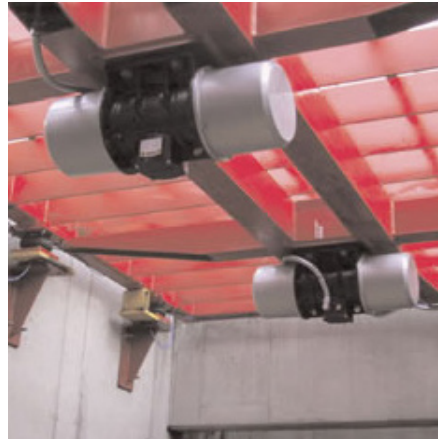
Montaje especial usado con vibradores electricos.