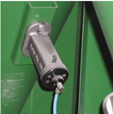
PKL® montando en un cono.